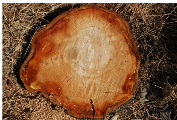
RYC. 3 Pozostałości dwóch pni drzew czereśni z sekcji M i U alei

Średnia wartość przyrostu rocznego wyliczona na podstawie metody świdra Presslera wyniosła odpowiednio: dla sekcji M i U – 0,28cm, natomiast dla sekcji D i G – 0,39cm.